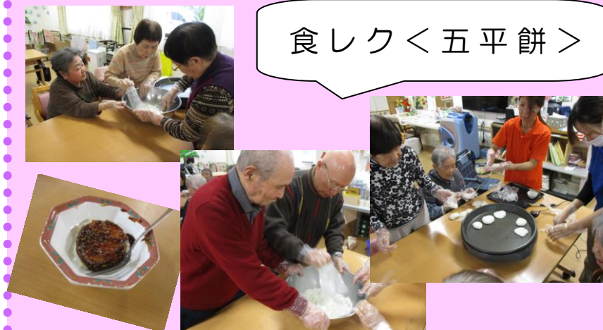
お米を潰し、五平餅を作りました！！味噌をかけて美味しくいただきました♪