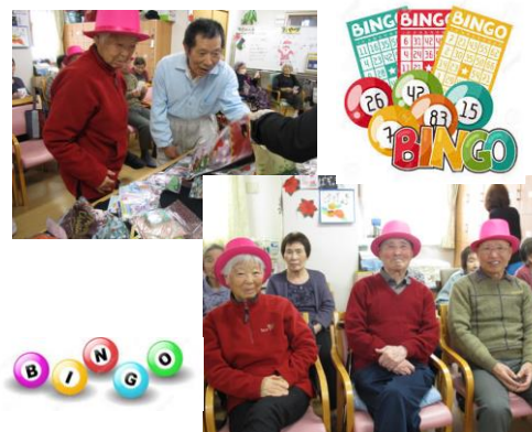
クリスマス会後にビンゴ大会を行いました☆盛り上がり、楽しんで頂けました♪