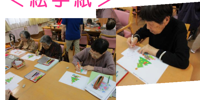
クリスマスツリーを書きました皆様、とてもお上手です♪