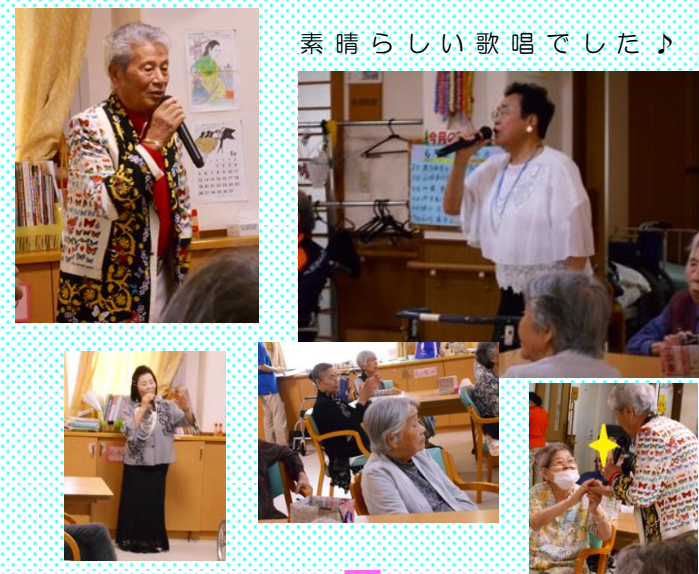
素晴らしい歌唱でした♪