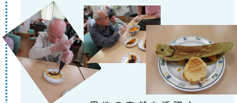
男性の方が大活躍！