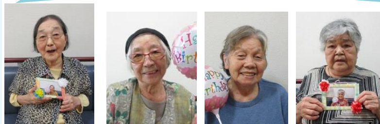
おめでとうございます！