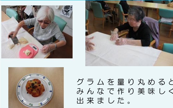
グラムを量り丸めるとみんなで作り美味しく出来ました。