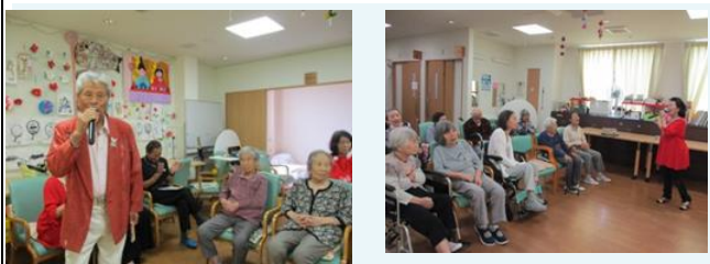
二人とも赤の衣装がお似合いで、目でも楽しめました。