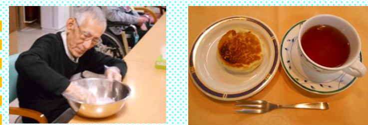
韓国のおやつ作りに挑戦♪おいしかった～！