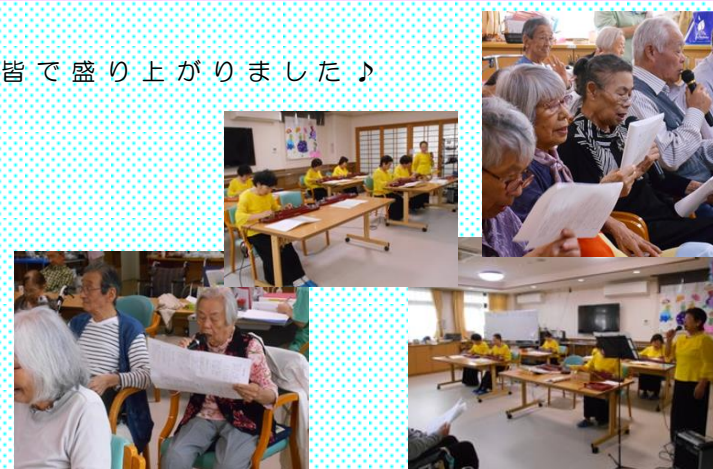
皆で盛り上がりました♪