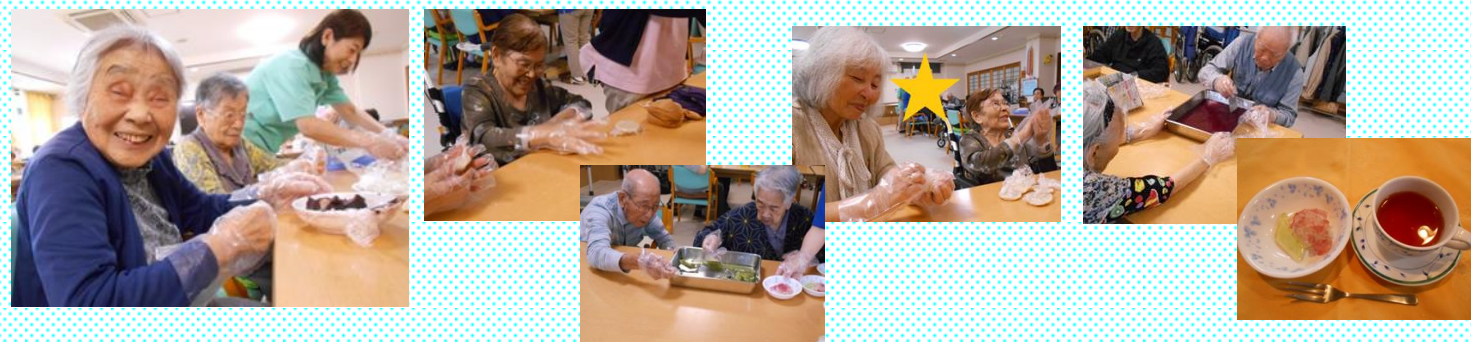
苦戦しましたが綺麗に出来上がりました♪