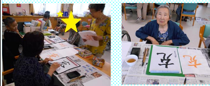
今回もたくさんご指導いただきました♪