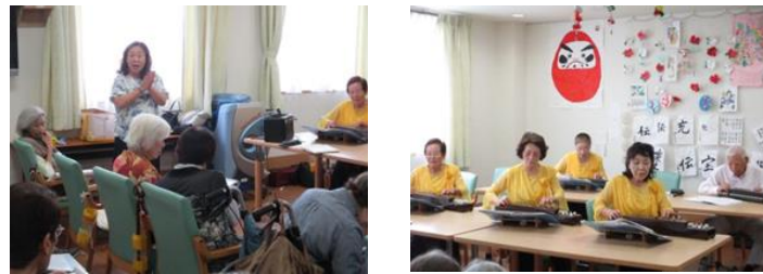
演奏と演奏の間の先生のお話も楽しみの一つです。