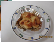
今月も美味しいパンが出来ました。