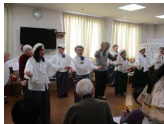
みんなで楽しくクリスマスソング♪