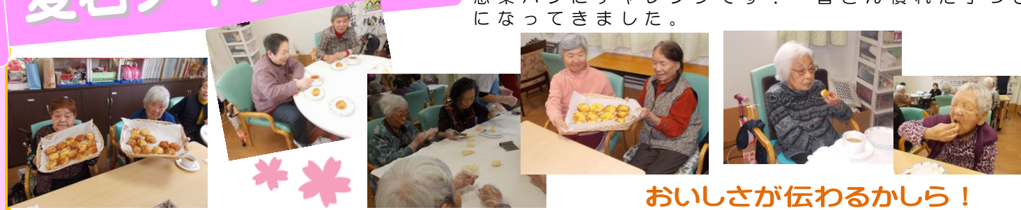
おいしさが伝わるかしら！