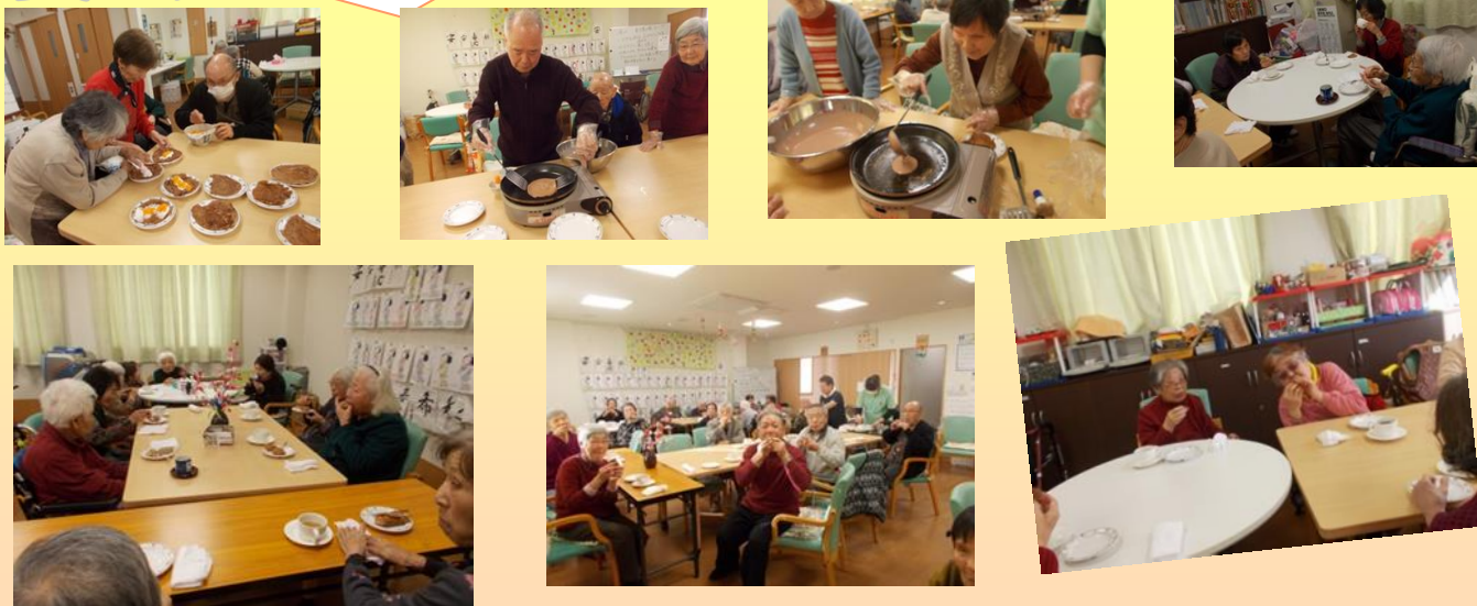
ココア風味の生地に果物・生クリームを包んでみんなで恵方に向かって”丸かじり！”