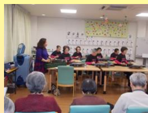
大正琴の音色は懐かしいですね・・・