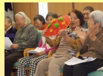
楽しいトークと素晴らしい歌声で楽しいひと時を過ごしました