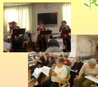
オカリナの優しい音色は癒されます。