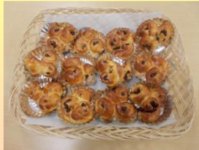
シナモンの香りとレーズンが何とも言えないハーモニー...