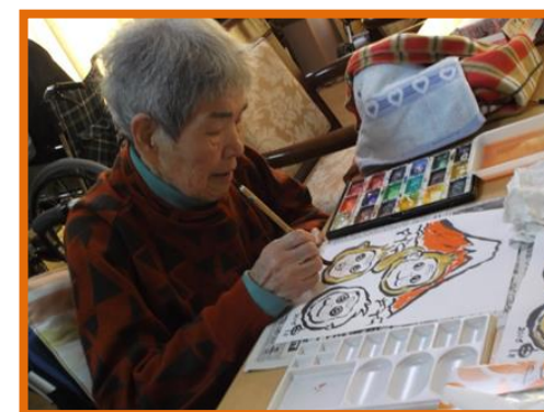
来年の干支「申」の水彩画にチャレンジ! 上手に完成されています。