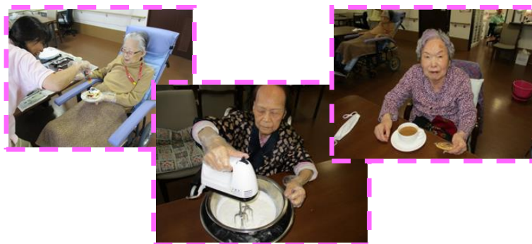
自分の為のオリジナルケーキ作り。フルーツいっぱい生クリームいっぱいとても美味しく出来上がりました。