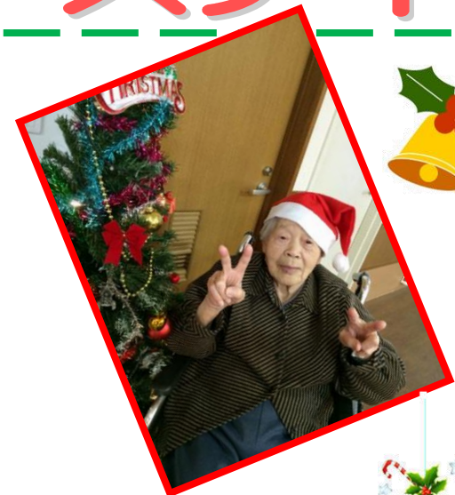
サンタさんの帽子で、クリスマス気分を味わっていただきました♪