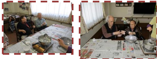
白玉粉をこねて ちぎって丸めて お湯の中へ。つるつる もちもちの触感です。