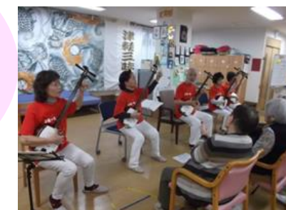
3ヵ月ぶりの来所でした。5人息ぴったりで流く素敵な音色が響いていました。