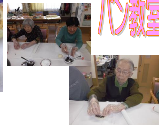
12月はクリスマスとの事でカラフルに飾りつけてみました～！！ナッツやチョコがふんだんにのっていました。