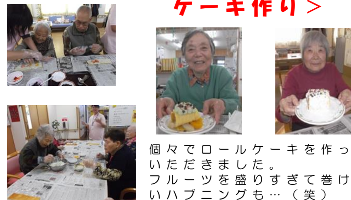
個々でロールケーキを作っていました。フルーツを盛りすぎて巻けないハプニングも…(笑)