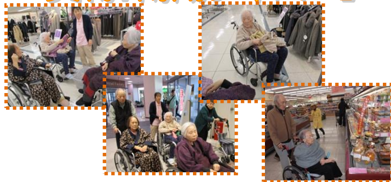
女性陣はやはりショッピングが大好きです。色々見て好みの物を買いました。