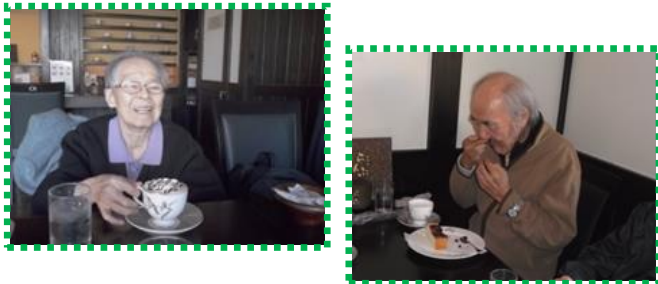
古民家風の喫茶店です。ココアが美味しいと聞いていたので注文しました。