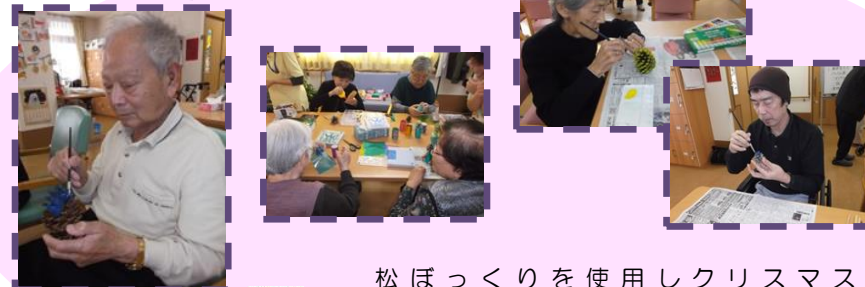
松ぼっくりを使用しクリスマスツリーを作りました。皆様夢中になって松ぼっくりに色をつけてみえました。