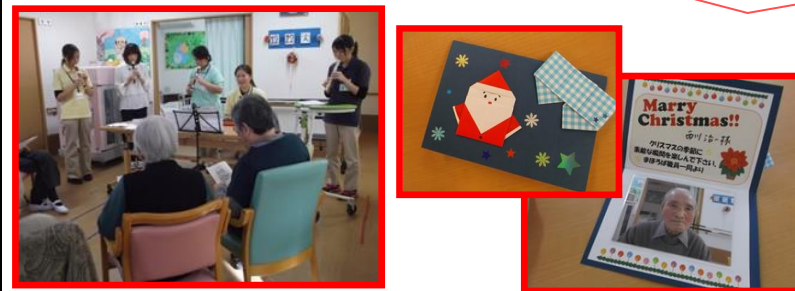
懐かしのリコーダーとキーボードの演奏を披露しました。演奏後には皆様にクリスマスカードのプレゼント！！皆さん喜んで下さったので職員も一安心。